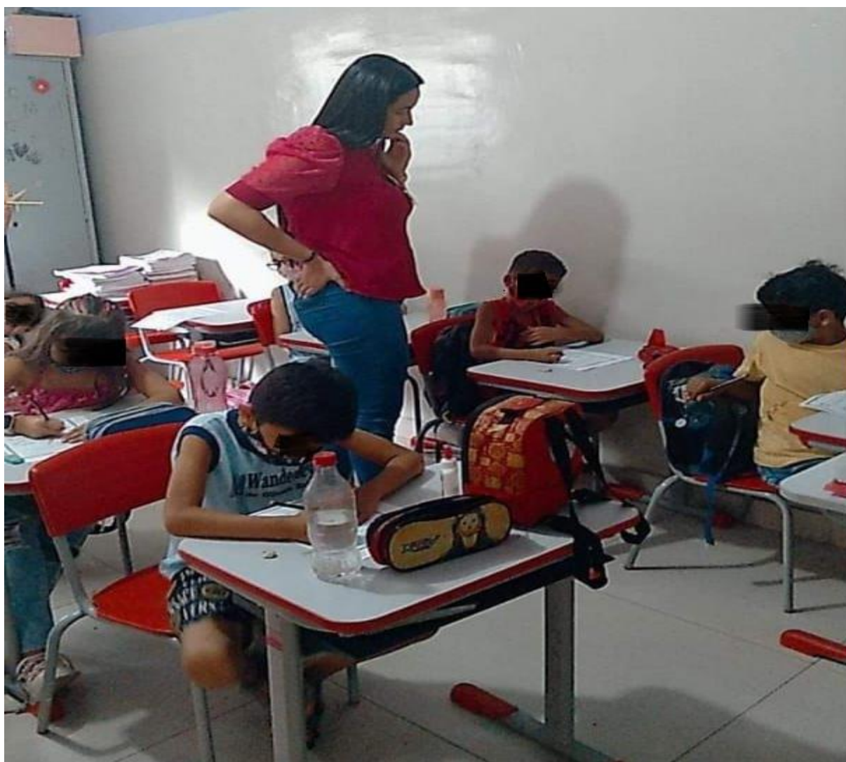
Figura 02- Observação do trabalho com o conto Chapeuzinho Vermelho.

apresentadas por Magda Soares (2020) comprovando assim que os mesmos são de grande valia para alfabetizar letrando como proposto pela autora que ressalta que o letramento é “a capacidade de uso da escrita para inserir-se nas práticas sociais e pessoais que envolvem a língua escrita, o que implica habilidades várias, tais como: capacidade de ler ou escrever para atingir diferentes objetivos”. (SOARES, 2020, p. 27).