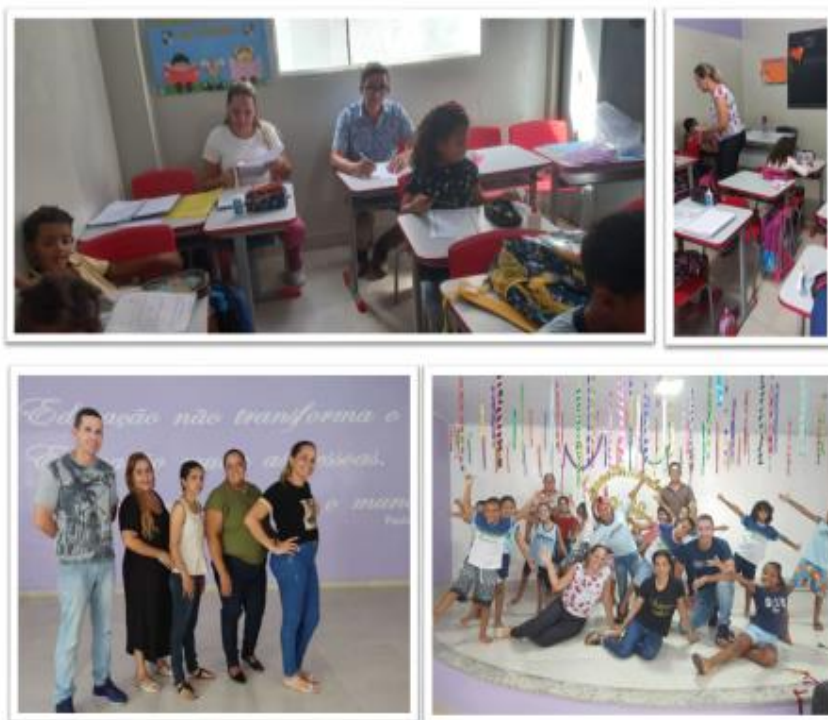
Rotina da prática pedagógica.