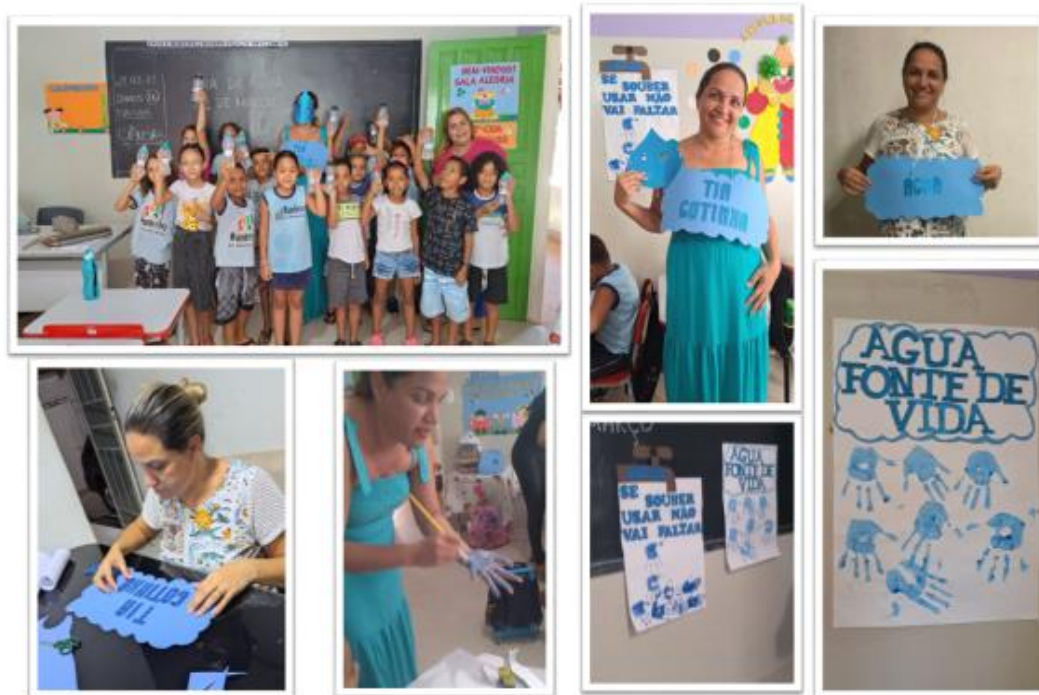
Comemoração Dia da Água