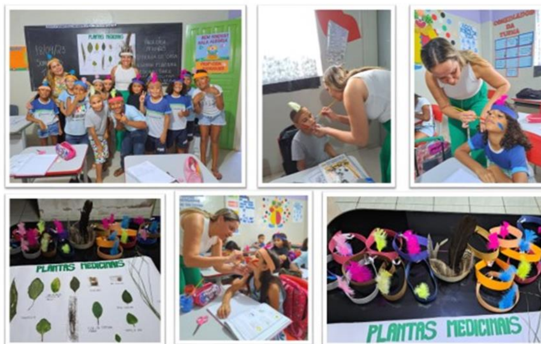
Aula sobre plantas medicinais e cultura indígena