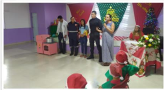
Apresentação teatral / fechamento do ano letivo