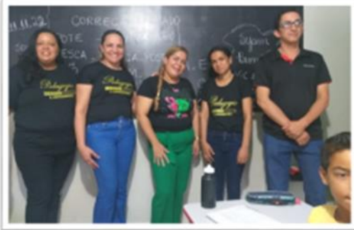
Aula e Contação de Estórias "Caixa Maluca"