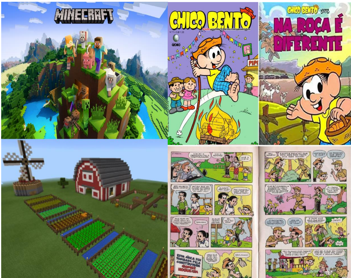
Figura 1 – montagem das representações do jogo minecraft e da revista em quadrinhos do Chico Bento.

O mesmo tipo de atividade usada no minecraft também pode ser feita através da montagem de maquetes, onde os alunos deverão gerar os dados a partir de uma observação numa visita à propriedade rural ou mesmo obtendo-as através de vídeos que revelem o cotidiano dos moradores do campo. Outra maneira de obter dados sobre o universo rural pode ser através da história em quadrinho de Chico Bento, colocando em destaque essa forma de expressão cultural que é pouco valorizada no universo da comunicação (BIAZI e MARTINS, 2010).