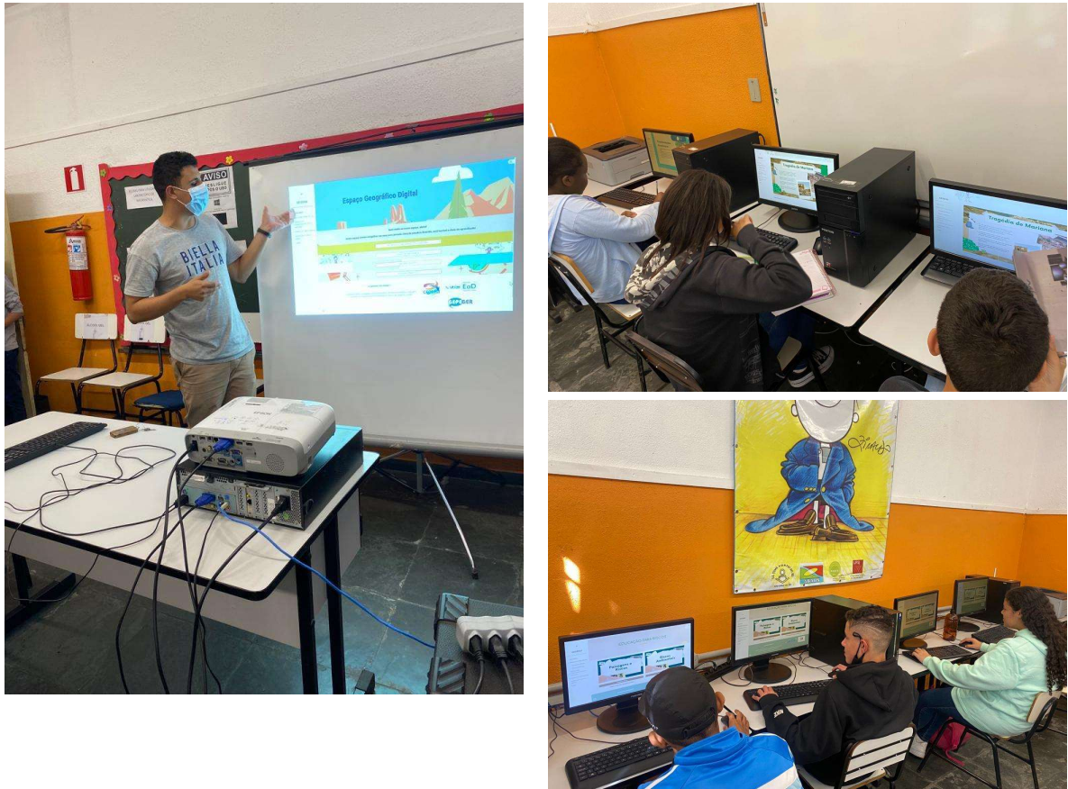
Figuras 5, 6 e 7 - Momentos de interação com o GEODIGI