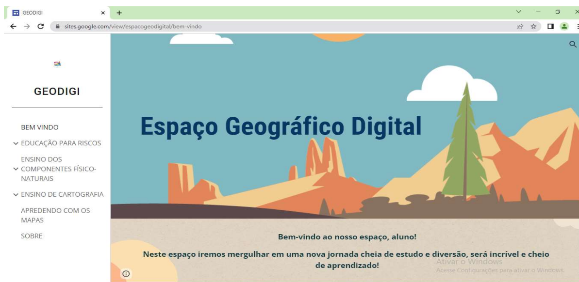
Figura 1 - Página inicial do GEODIGI

A página principal do site (BEM VINDO) é composta de vários menus que são atualizados com a criação de novos conteúdos. A Figura 1 apresenta a interface da página inicial do site, que possui um menu à esquerda, indicando os conteúdos disponíveis no site.