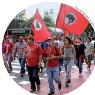
↑ Manifestação do MST em São Paulo (SP). Foto de 2016.

Em 1984, foi criado o Movimento dos Trabalhadores Sem Terra (MST) , que se tornou o maior movimento de luta pela reforma agrária no Brasil. Algumas das principais estratégias do MST são protestos e passeatas, organização de acampamentos nas proximidades dos latifúndios improdutivos e ocupação de terras.