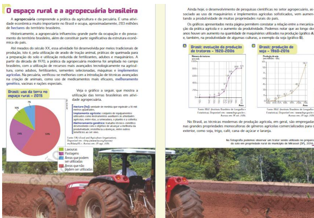
Figura 6 - Espaço rural e agropecuária brasileira