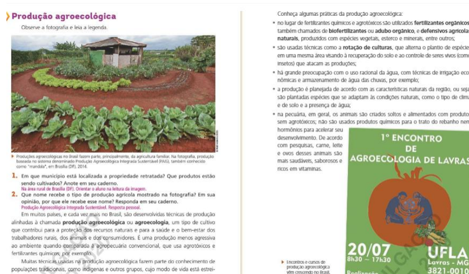
Figura 9 - Produção agroecológica