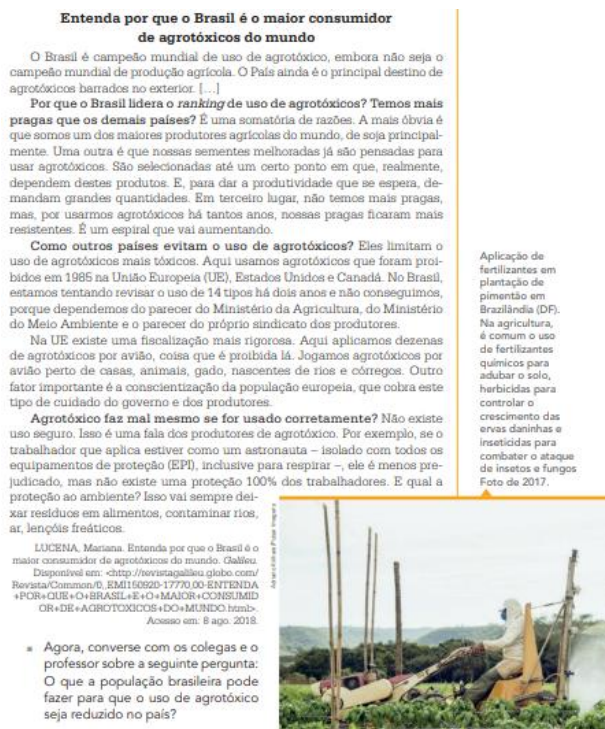
Figura 8 - Consumo de agrotóxicos