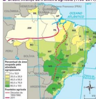
Brasil: Avanço da fronteira agrícola (1950-2011)