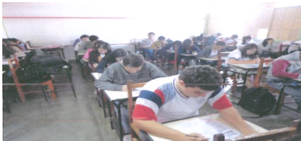
Figura 2: Aplicação dos Simulados para os alunos dos terceiros anos

A Figura 2 mostra os alunos que iam prestar o ENEM fazendo um simulado. Esta ação foi planejada pelos pibidianos juntamente com o professor supervisor.