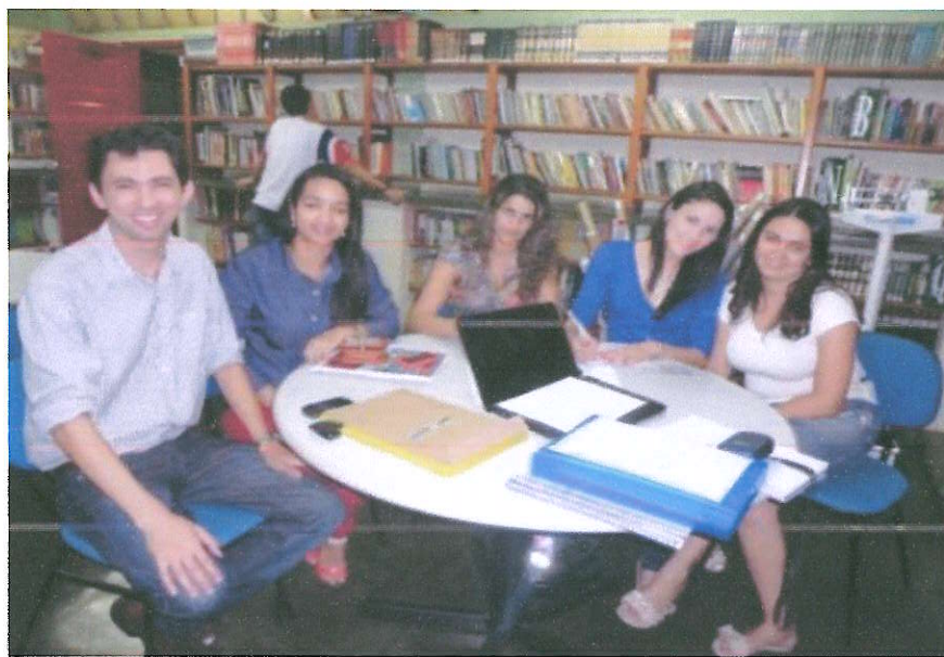
Figura 3: Equipe do PIBID de Física da UFVJM elaborando as atividades diagnósticas

Podemos observar na Figura 3 a equipe de Física da UFVJM elaborando atividades diagnósticas.