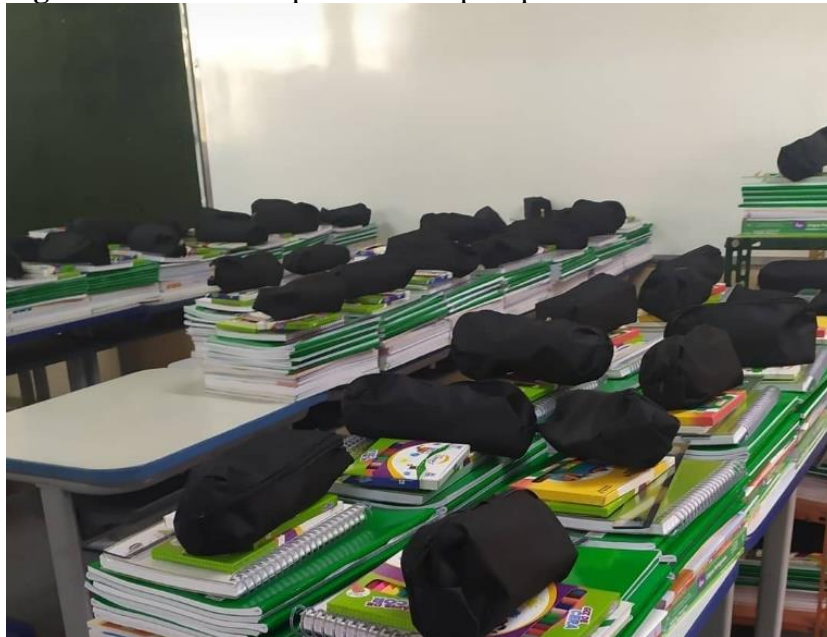
Figura 2: Material disponibilizado pela prefeitura

No início do ano letivo, a prefeitura fornece a escola todo o material escolar (estojo, caixa de lápis de cor, tinta, cola, giz, lápis de escrever, borracha, apontador, régua, tesoura, canetas azul e vermelha) para os alunos além do uniforme completo (2 camisas, 1 calça e 1 short)(Figura 2). Diariamente, eles ganham lanche no início da aula (café da manhã ou café da tarde) e no final (almoço ou jantar).