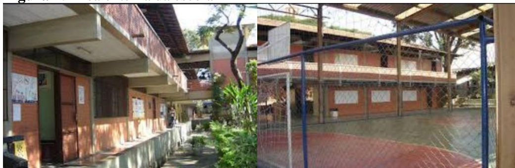
Figura 1: Área externa da escola

Desde sua fundação em 1971, a escola passou por diversas reformas e obras de expansão, sendo a última em 2021. Atualmente o espaço físico da escola é composto por 10 salas de aula, sala de informática, sala multiuso, ateliê, quadra de esportes, banheiro feminino e banheiro masculino para crianças menores e um de cada para crianças maiores, banheiro de inclusão feminino e masculino, 3 banheiros para adultos, parquinho, sala da direção, sala da coordenação, secretaria, biblioteca, jardim literário, cantina com pátio, dispensa, 2 depósitos de matérias, sala de máquinas, sala dos professores, garagem e 4 portões de acesso dos quais 2 possuem rampas (Figura 1).