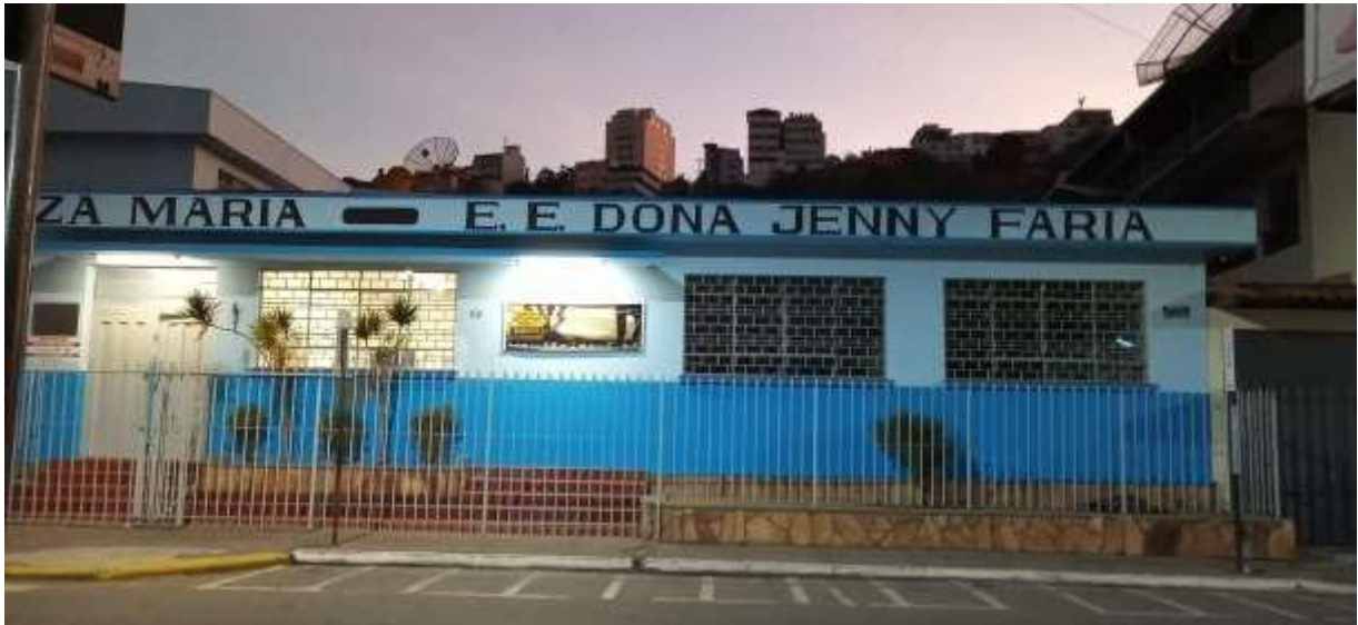
Faixa da Escola Estadual Dona Jenny