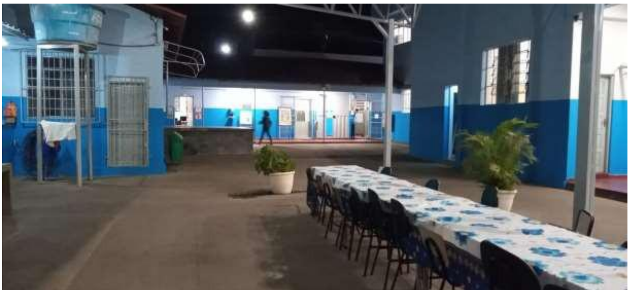
Pátio da Escola Estadual Dona Jenny Faria